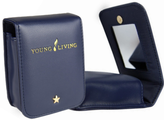
NEU! KLASSISCHES LIP BALM-CASE #42277 Enthält: Klassisches Lip Balm-Case (10 cm x 8 cm x 3 cm)